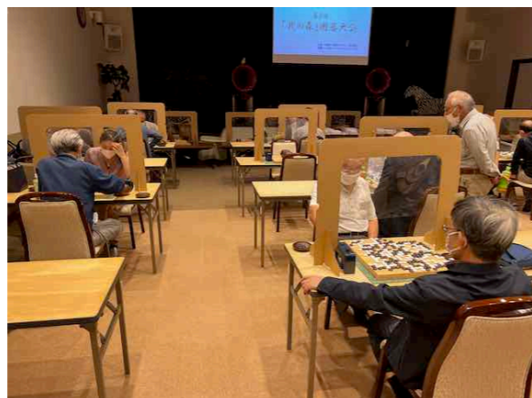
第3回「北の森」 囲碁大会 (令和4年9月25日) の様子