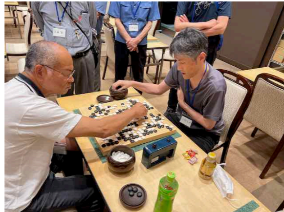
第10回「北の森」囲碁大会 (令和5年7月30日) の様子